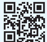
Aplicación móvil MyBlueKC

Llame al número del Servicio de Atención al Cliente de Blue KC que figura en su tarjeta de identificación de miembro. Gestione su cobertura de Blue KC desde cualquier lugar descargando la aplicación móvil MyBlueKC.